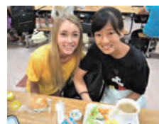
1日長い時間を共に過ごすので最後に渡せる「Thank you Card」のほか、話題作りに日本らしい小物やお菓子などを準備してみては？