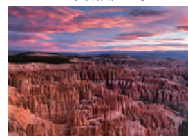
並ぶ光景は大自然の芸術そのもの。動きやすい服装と歩きやすい靴をご用意ください。